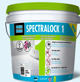
Fiche technique 36589.0