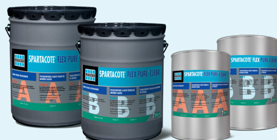
Fiche technique 86.6