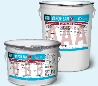
Data Sheet 35216.0