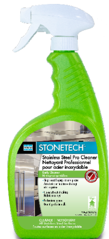
Data Sheet 234.0

Stainless steel. Do not use on colored concrete, dyed granite, and acid-sensitive stones such as marble, limestone, and travertine.