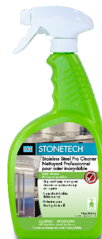
Fiche technique 234.0

Acier inoxydable. Ne pas utiliser sur du béton coloré, du granite teint et sur des pierres sensibles à l'acide comme le marbre, le calcaire et le travertin.