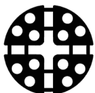
NXT Pedestal Rubber Shim