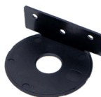
NXT Pedestal Timber Joist Bracket