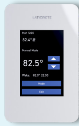
Thermostat LCD programmable STRATA_HEAT Fiche de données 65447