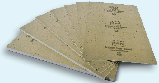
Feuille de données 040.0