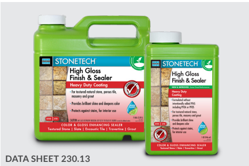
DATA SHEET 230.13