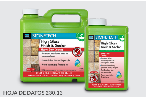
HOJA DE DATOS 230.13