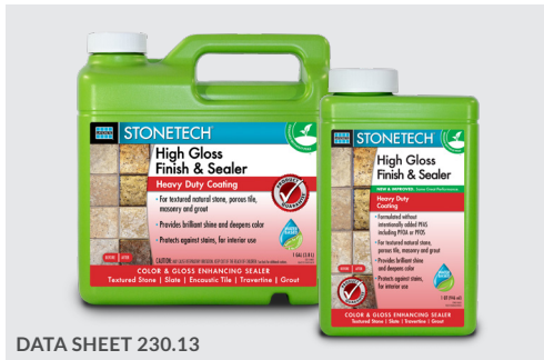
DATA SHEET 230.13