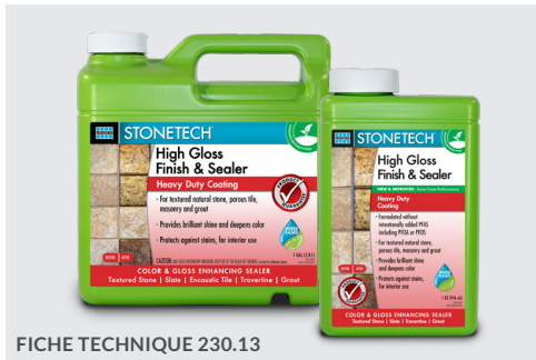
FICHE TECHNIQUE 230.13