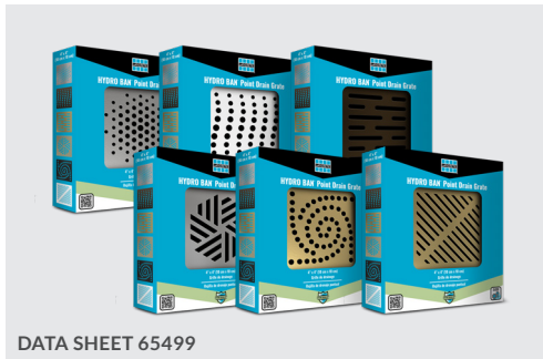
DATA SHEET 65499