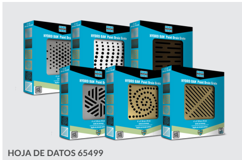
HOJA DE DATOS 65499