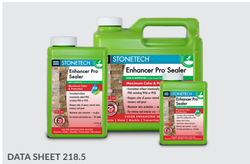
DATA SHEET 218.5