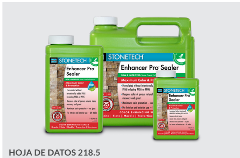
HOJA DE DATOS 218.5